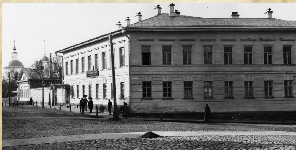
Исторический вид современного здания ДШИ №8 им. В.Ю. Виллуана на ул. Варварской, г. Нижний Новгород

В Чтениях участвовали ученики и преподаватели Ленинградской (г.п. Рощино), Тамбовской (г. Рассказово), Вологодской (г. Череповец) областей, г. Смоленска, г. Нижнего Новгорода (ДШИ №/№ 4, 6 им. А.А. Касьянова, 8 им. В.Ю. Виллуана, им. Д.Д. Шостаковича, 14, 17 им. А. Цфасмана, ДДТ им. В. Чкалова) и Нижегородской области (р.п. Шатки, с. Линда, г. Богородск, г. Володарск, г. Дзержинск).