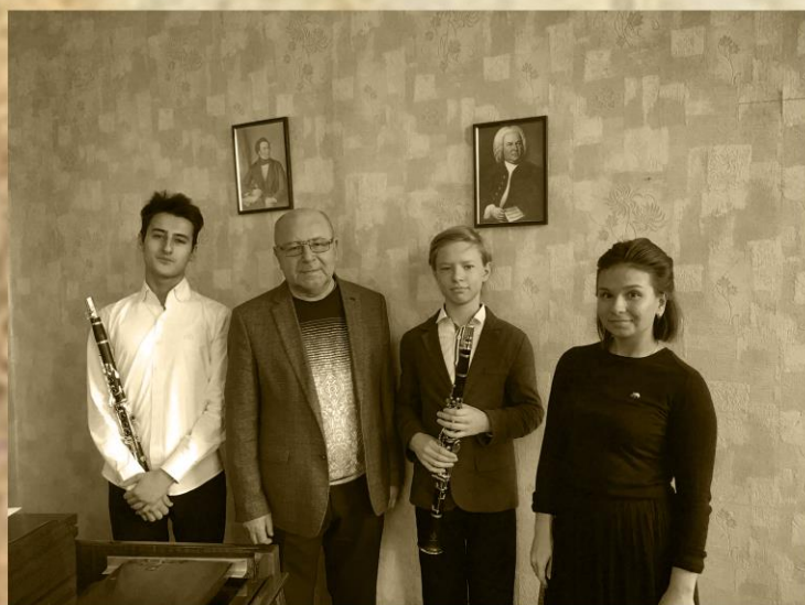
Представители НМУ им. М.А.Балакирева